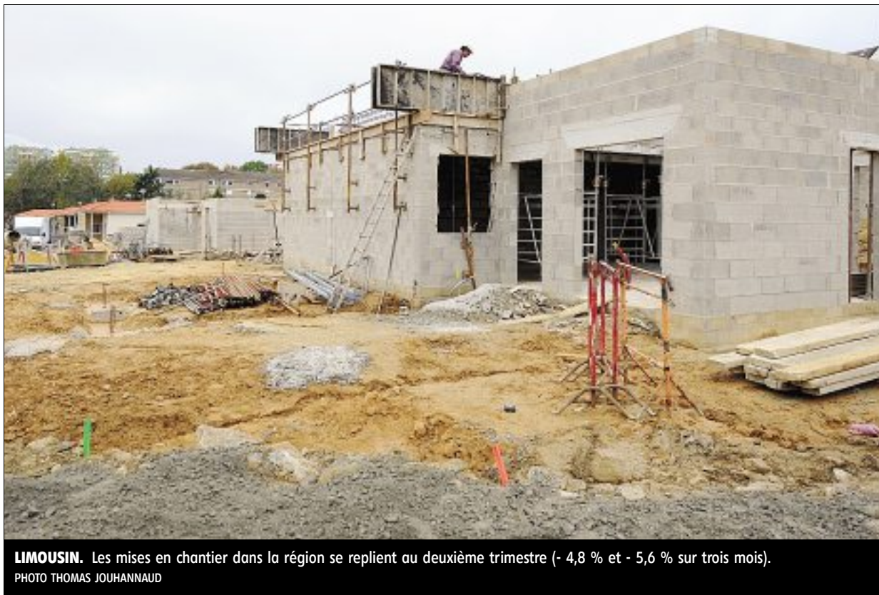
LIMOUSIN. Les mises en chantier dans la région se replient au deuxième trimestre (- 4,8 % et - 5,6 % sur trois mois).

Pour ce deuxième trimestre 2014, l'Insee (Institut national de la statistique et des études économiques) annonce une timide progression de l'économie française (+ 0,1 %). Le pays se place en troisième position derrière l'Allemagne et l'Espagne, plus dynamiques.